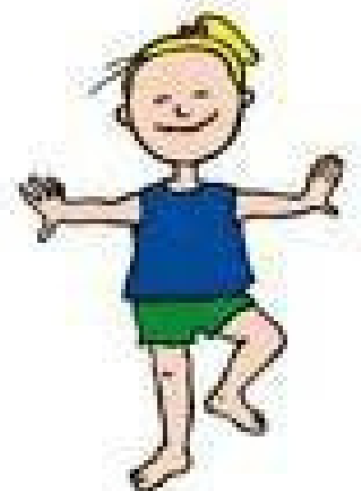
Bewegen op muziek