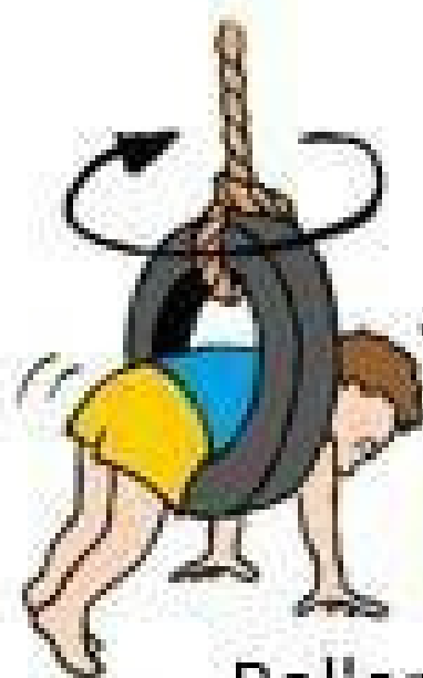
Rollen en draaien