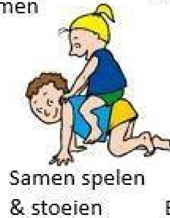
Samen spelen & stoeien