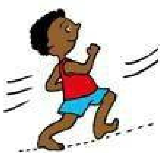
Rennen en gaan

elke donderdag vanaf 2 september 14:30 - 15:15 uur gymzaal Balk